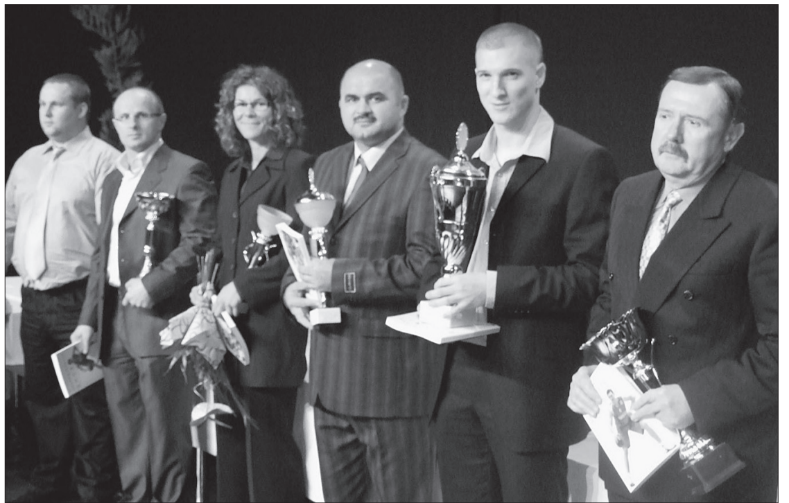
A megye legjobbainak választott sportolók és edzők